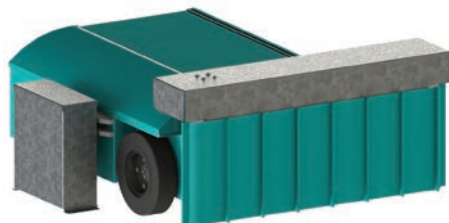
Le robot retourne automatiquement à son plot de charge